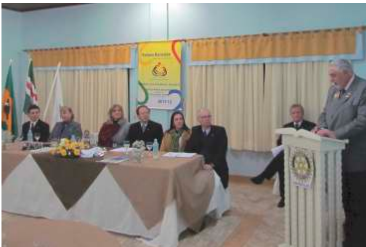
RC de São Miguel d'Oeste