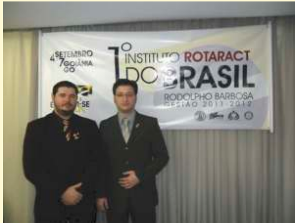
Representadoria Distrital de Rotaract Club - Distrito 4740

Só foi possível a participação destes integrantes no evento pelo grande incentivo oferecido pelo Distrito 4740 através da pessoa do Governador Célio Valtair Gomes que não mediu esforços para que os rotaractianos pudessem participar junto aos grandes representantes de rotary no Brasil e até do mundo.