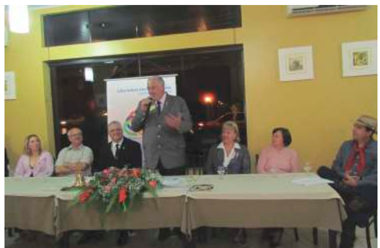
RC de São Carlos