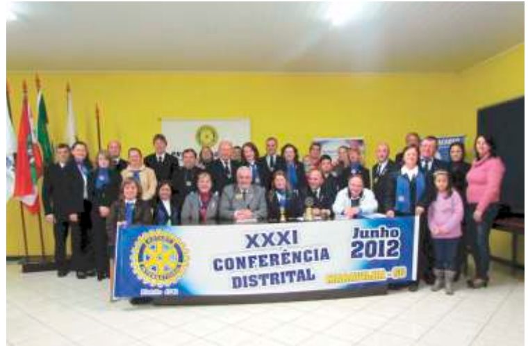
RC de Maravilha