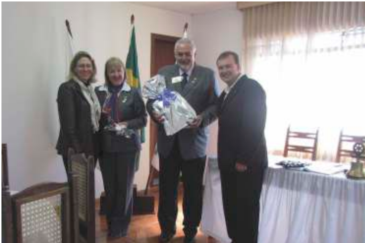
RC de Porto União - União da Vitória