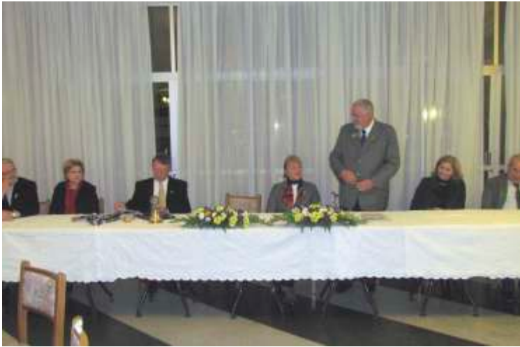
RC de Mafra