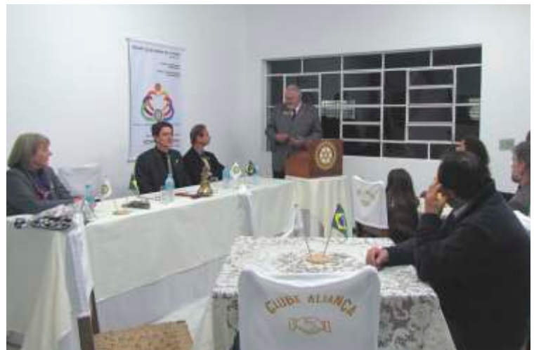
RC de União da Vitória - Porto União